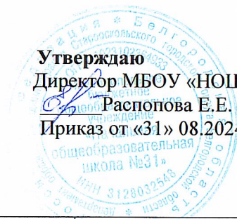
График оценочных процедур на IV четверть 2024-2025 учебного года