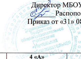
График оценочных процедур на I четверть 2024-2025 учебного года